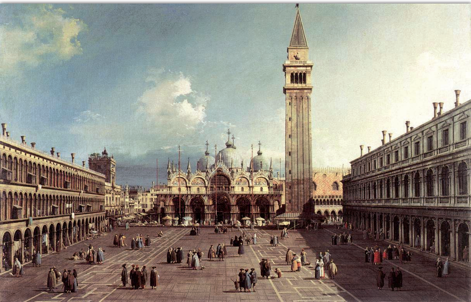
Piazza San Marco con la basilica, Canaletto, 1730, Fogg Art Museum Cambridge