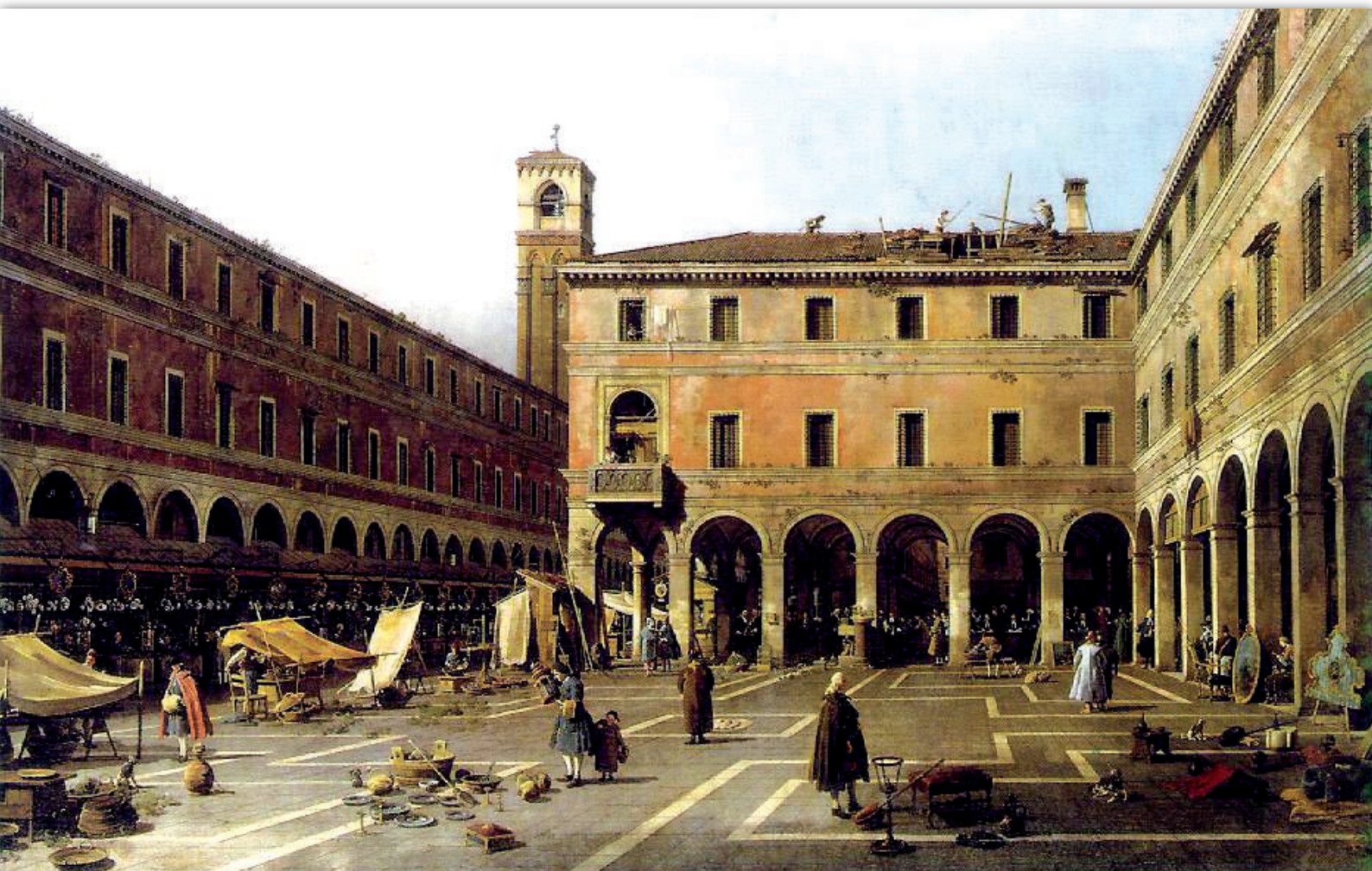
Il Campo di Rialto, Canaletto 1756, Gemäldegalerie, Berlin

RE-INGEGNERIZZAZIONE DELLA PREVENZIONE INDIVIDUALE E PROGRAMMI DI SCREENING: EFFICACIA, QUALITÀ E SOSTENIBILITÀ